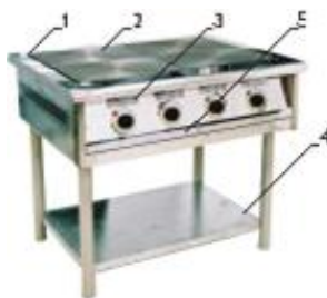
Рис. 1 Плита ПЕ-4

1 – корпус; 2 – конфорки; 3 - панель управления; 4 – подставка с полкой; 5- поддон