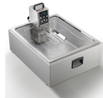
Container 2/1 gastro